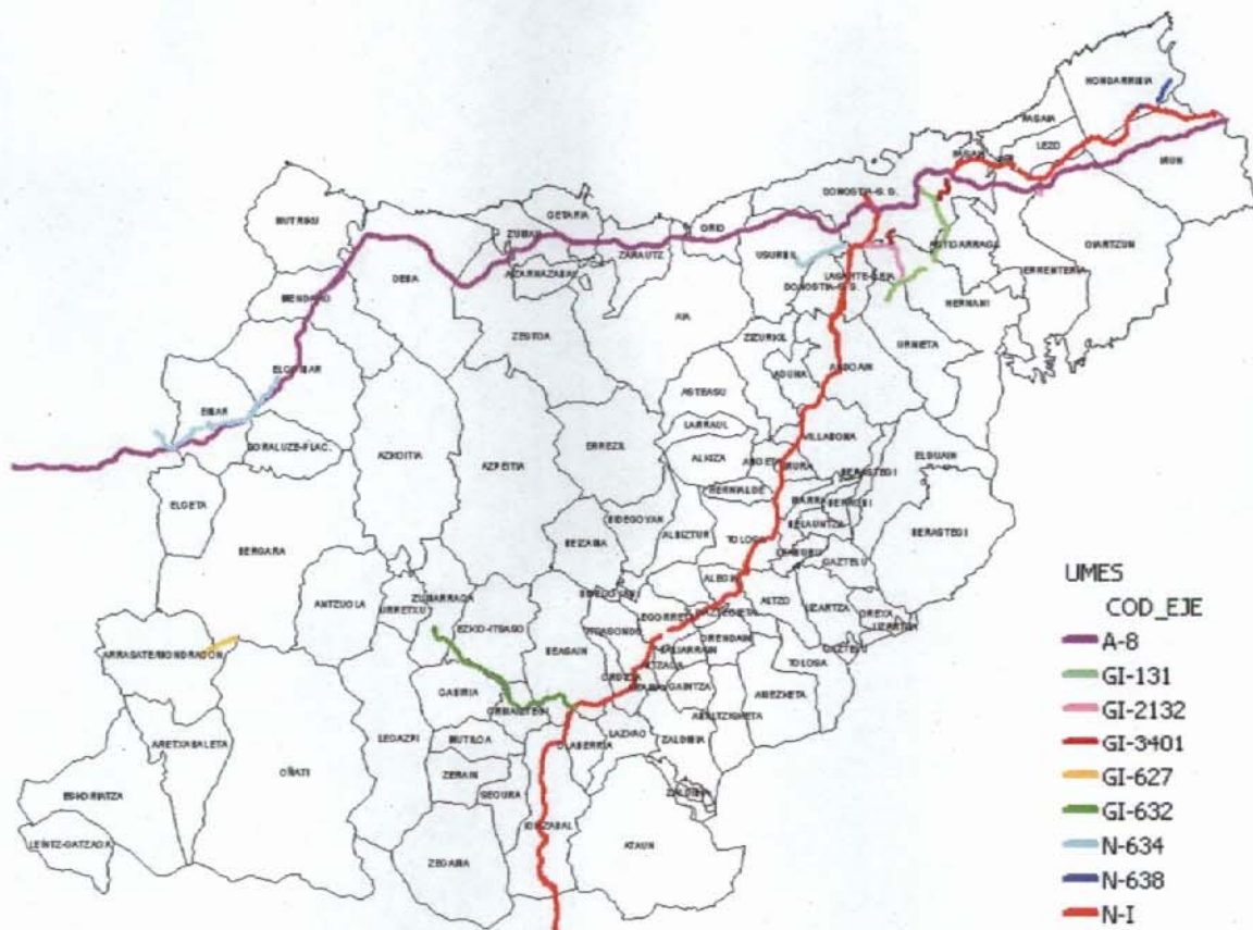
Descripción de los tramos de carretera incluidos en las UMEs