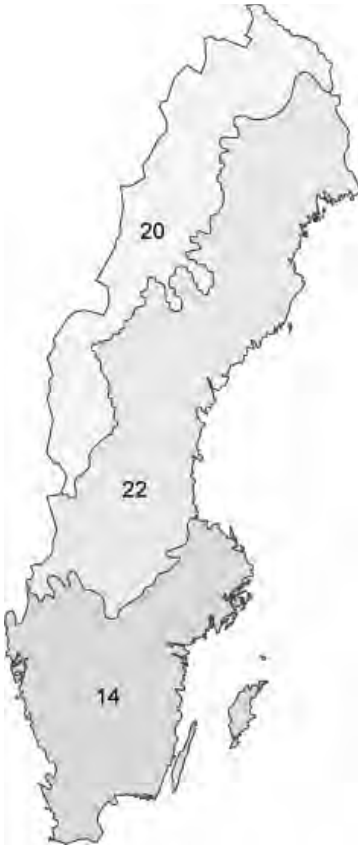
Figur 4.1. Illies ekoregioner, Centralslätten (14), Fennoskandiska skölden (22) och det Boreala höglandet (20).

Region 20: MILA_{ref} = -1,69 + 0,386 pH_{ref}