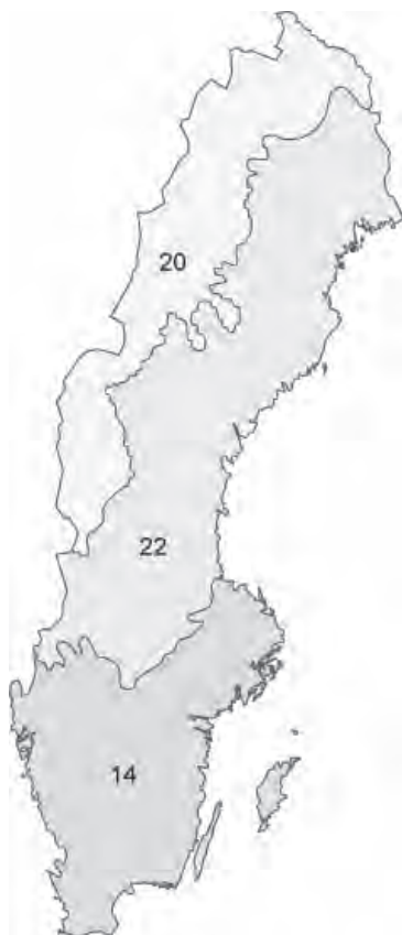
Figur 5.1. Illies ekoregioner, Centralslätten (14), Fennoskandiska skölden (22) och det Boreala höglandet (20).